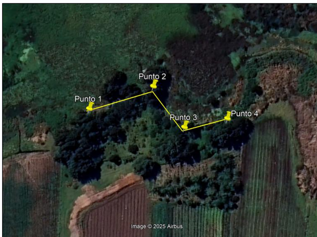
Ilustración 1. Recorrido

Con base en lo anterior, el día 10 de noviembre de 2025 se realizó recorrido de control y vigilancia en el humedal Gualí desde las coordenadas 4°42'18,294" N-74°11'37,572" W hasta las coordenadas 4°42'17,076" N-74°11'40,014" W (ver ilustración 1. Ruta amarilla) vereda El Hato, ecosistema que fue declarado por la Corporación Autónoma Regional de Cundinamarca - CAR como Distrito Regional de Manejo Integrado a través el acuerdo 001 de 2014 "Por medio del cual se declaran como Distrito Regional de Manejo Integrado (DMI), los terrenos comprendidos por los humedales de Gualí, Tres Esquinas y Lagunas de Funzhé, y su área de influencia directa ubicada en los municipios de Funza, Mosquera y Tenjo, Cundinamarca", y estableció tres zonas: 1. Preservación (espejo de agua), 2. Recuperación (50 metros) y 3. Uso sostenible (100 metros).